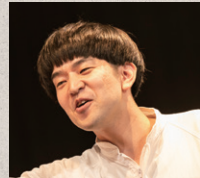
一宮周平 脚本家・演出家・俳優